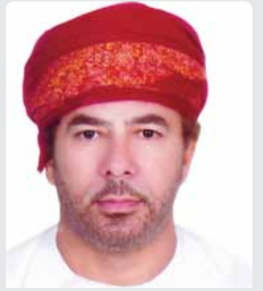
بقلم ناصر بن سالم الحمدي كاتب وإعلامي

حظيت المرأة العمانية منذ بداية العهد الزاهر على الكثير من المكاسب وتبوءت مكانة مرموقة في المجتمع وذلك بفضل الاهتمام السامي لحضرة صاحب الجلالة السلطان قابوس بن سعيد المعظم حفظه الله ورعاه وأيده بنصره فقد فتح أمامها الأبواب مشرعة لتحقيق ذاتها وأولاه الرعاية والعناية لتؤدي دورها في المجتمع كشريك وليس كتابع مثلما تنتهج بعض الدول.. وبدورها عضت المرأة العمانية على الفرصة الذهبية بالنواجذ ووقفت بجوار أخيها الرجل خلال مسيرة التنمية فأبدعت وحققت الإنجازات تلو الأخرى وتبوءت مكانة مرموقة تبرز جهودها وإبداعاتها وشغلت مناصب مهمة في جميع التخصصات فأصبحت وزيرة وطبيبة ومهندسة ومعلمة وإعلامية وأديبة وشرطية وموظفة وسيدة أعمال وكافة مجالات المجتمع التي تدل على أنها شريك إيجابي في مسيرة التنمية الوطنية.