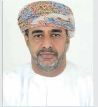
بقلم: سليم الدرعي